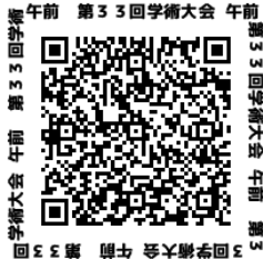
学術大会 午前 10:00～12:30

なお兵庫県放射線技師会ウェブサイトからも登録可能です。詳しい登録方法については予稿集に掲載しております。皆様の参加および参加登録をお待ちしております。