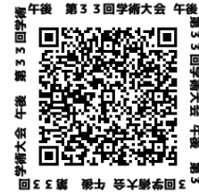
学術大会 午後 14:30～16:00