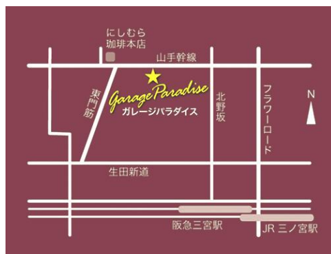
ガレージパラダイス MAP