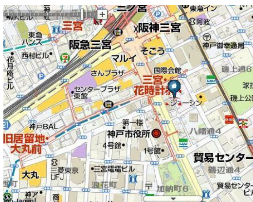
エーザイ株式会社 MAP