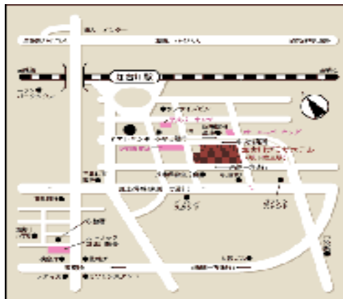
第8回放射線診療技術研究会 加古川プラザホテル地図