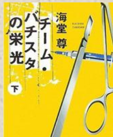
チーム・バチスタの栄光