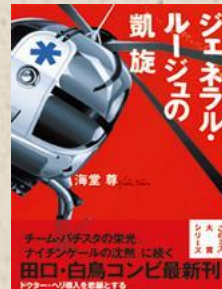
ジェネラル・ルージュの凱旋