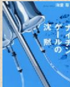
ナイチンゲールの沈黙